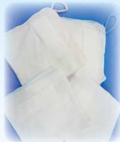
お手拭ガーゼ・給食おしぼり