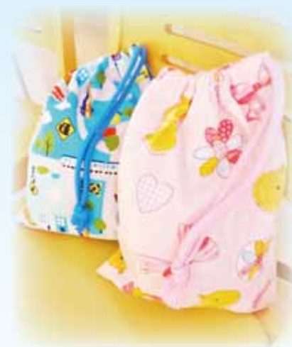
パジャマ袋・上ばき入れ