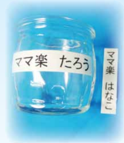
ネームシールセット